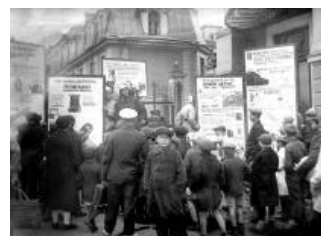
Выставка «Антропогенный фактор пожара», Сибирь, 1935 год.

Спустя некоторое время появился новый указ Петра, согласно которому на жителей возлагалась обязанность чистить печные трубы каждый месяц (под страхом весьма значительного штрафа, назначенного за неисполнение правила). Надзор за исполнением всех этих предписаний в то время был возложен на полицию.